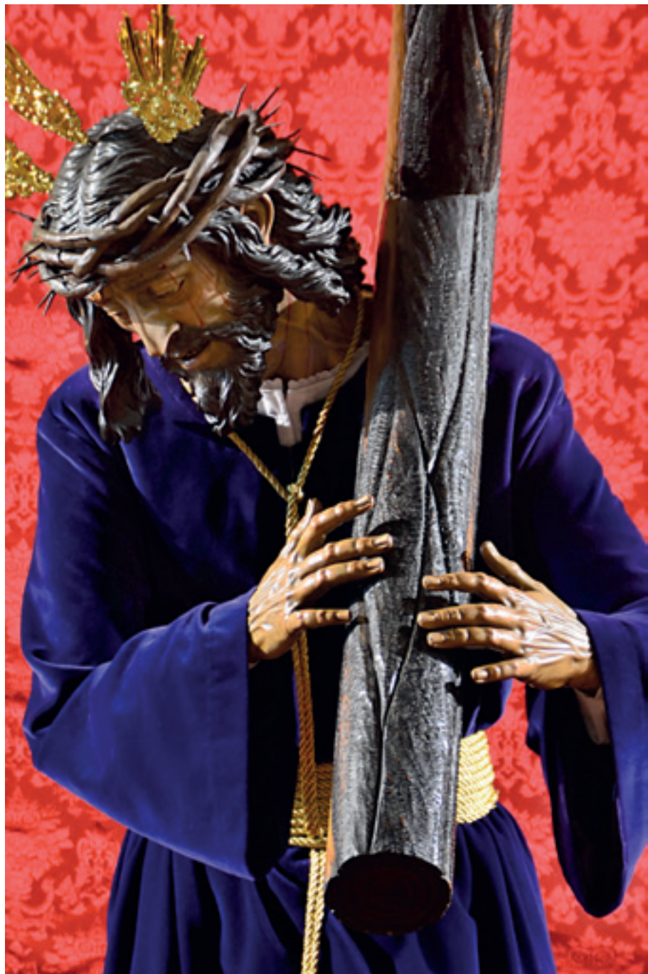
Ntro. Padre Jesús Nazareno