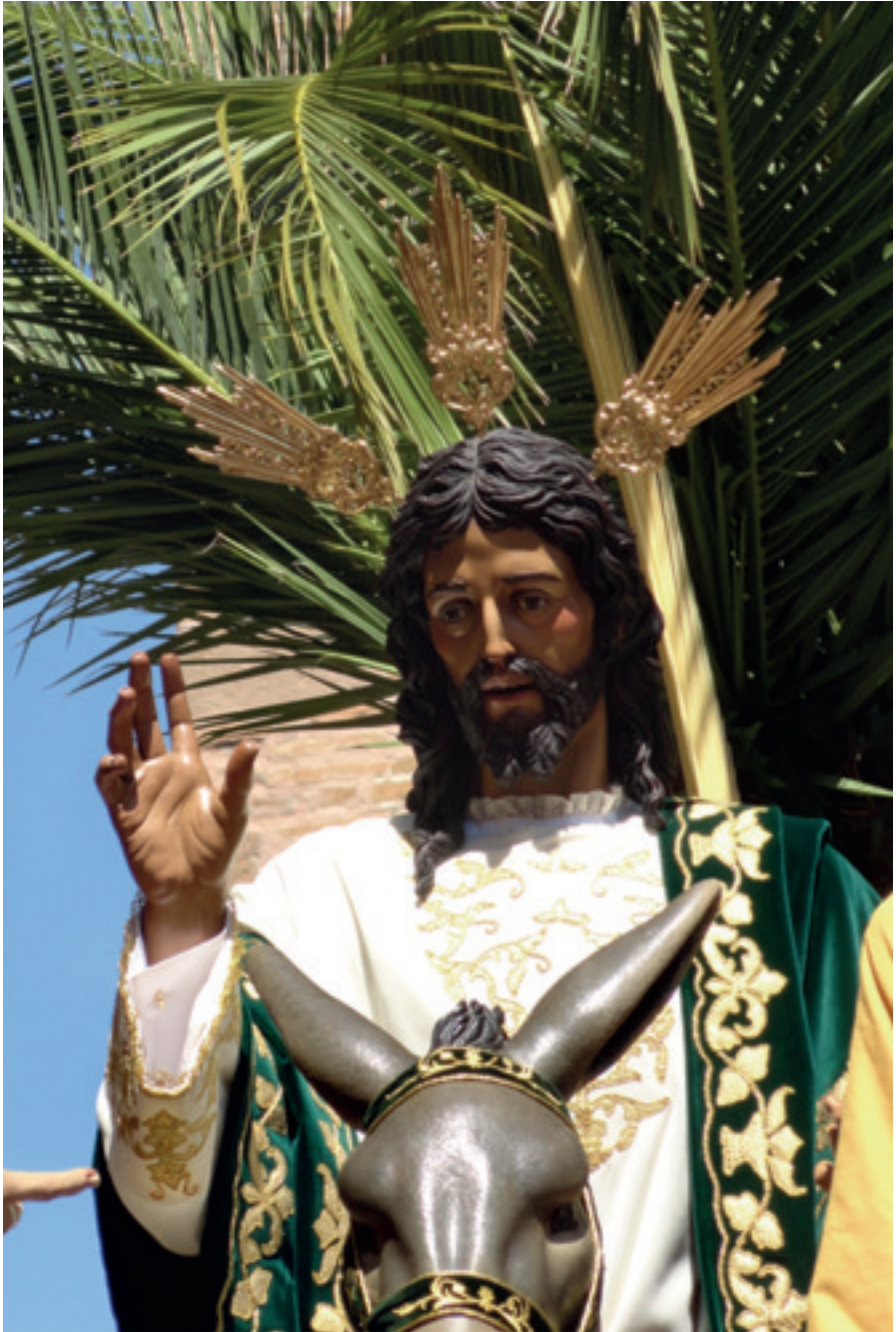
Señor de la Paz en su Entrada Triunfal en Jerusalén