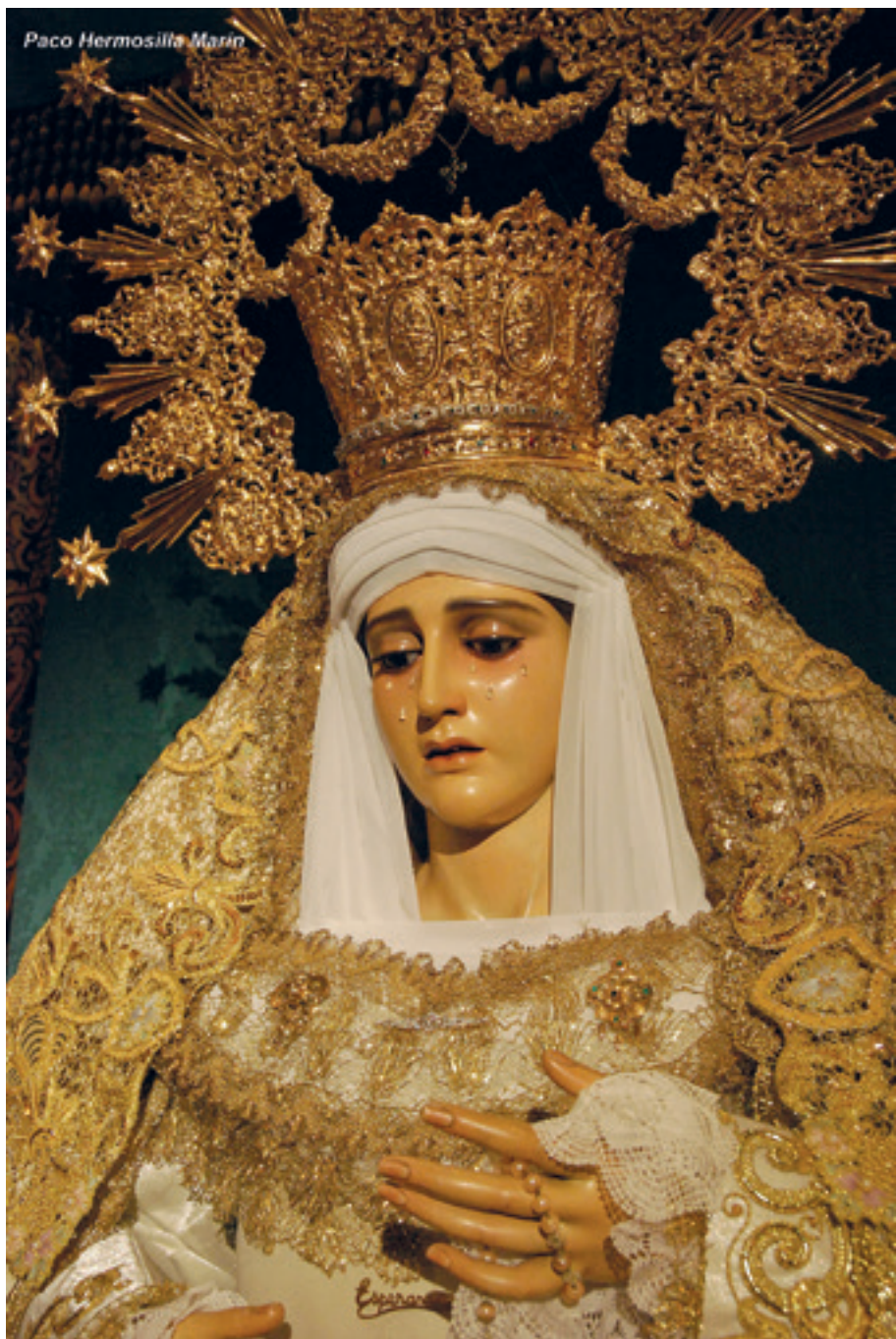
Ntra. Señora de la Esperanza