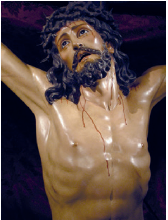
Cristo de la Expiración