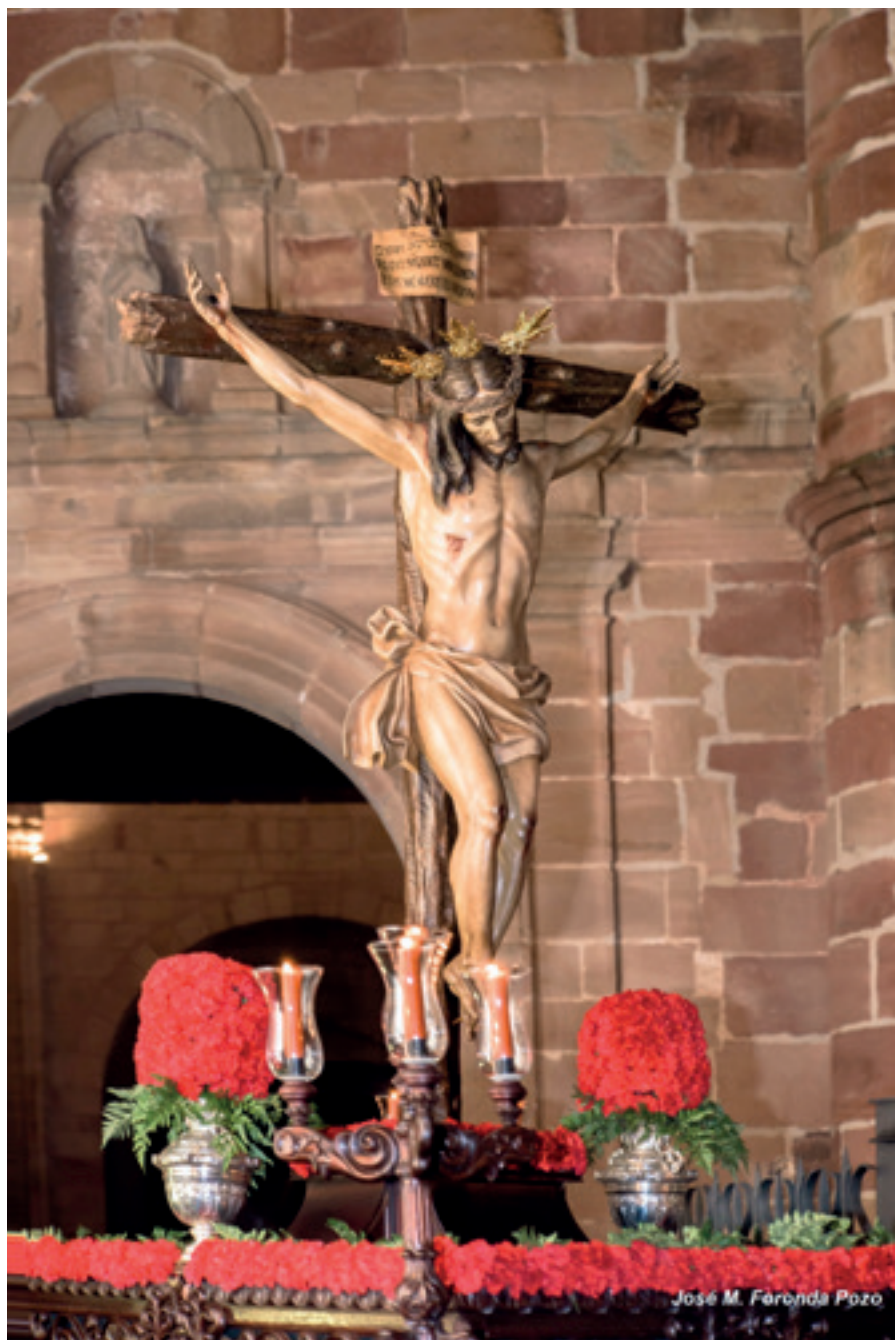
Santísimo Cristo de la Providencia