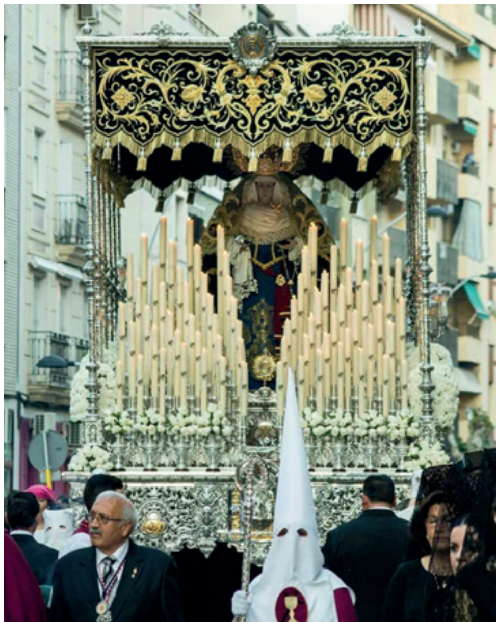
Ntra. Señora de los Dolores