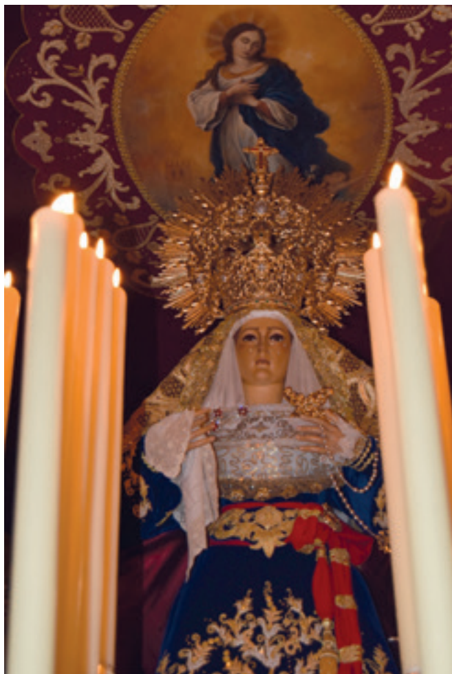
Ntra. Señora del Rosario