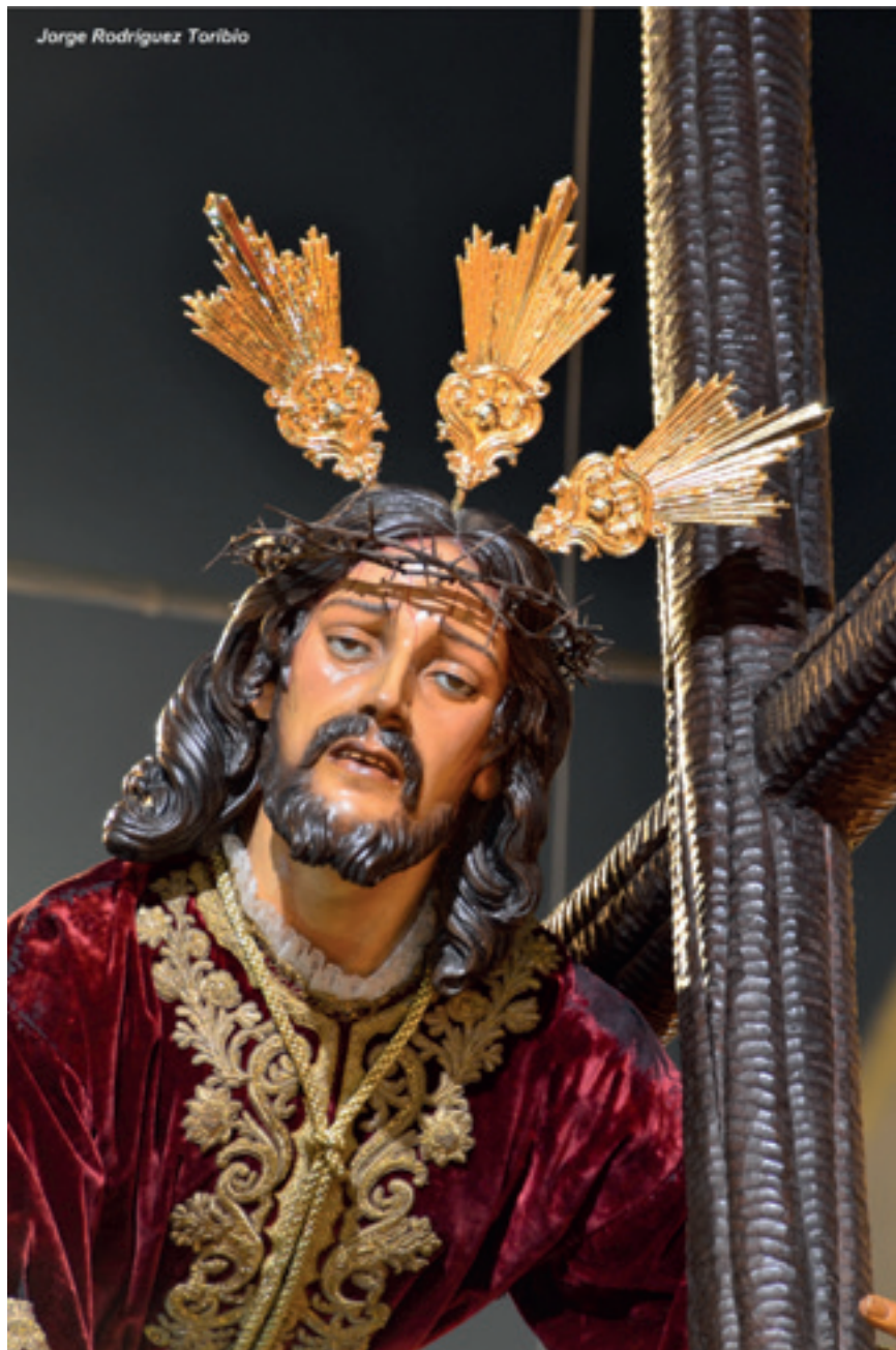
Ntro. Padre Jesús Caído