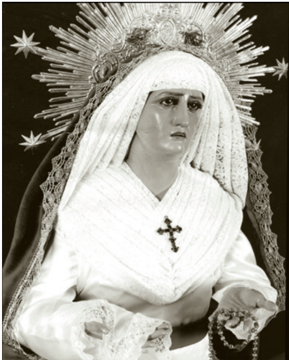
Nuestra Señora de los Dolores