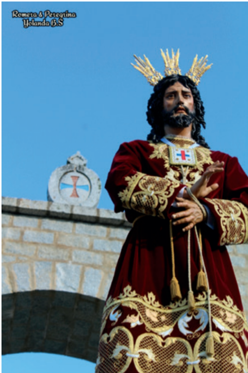
Jesús Cautivo de Sierra Morena

Acompañado por cientos de personas y especialmente por mujeres vestidas de mantilla. La parte musical, será aportada por la banda de música: Agrupación Musical Dulce Nombre de Jesús de Alcalá la Real.