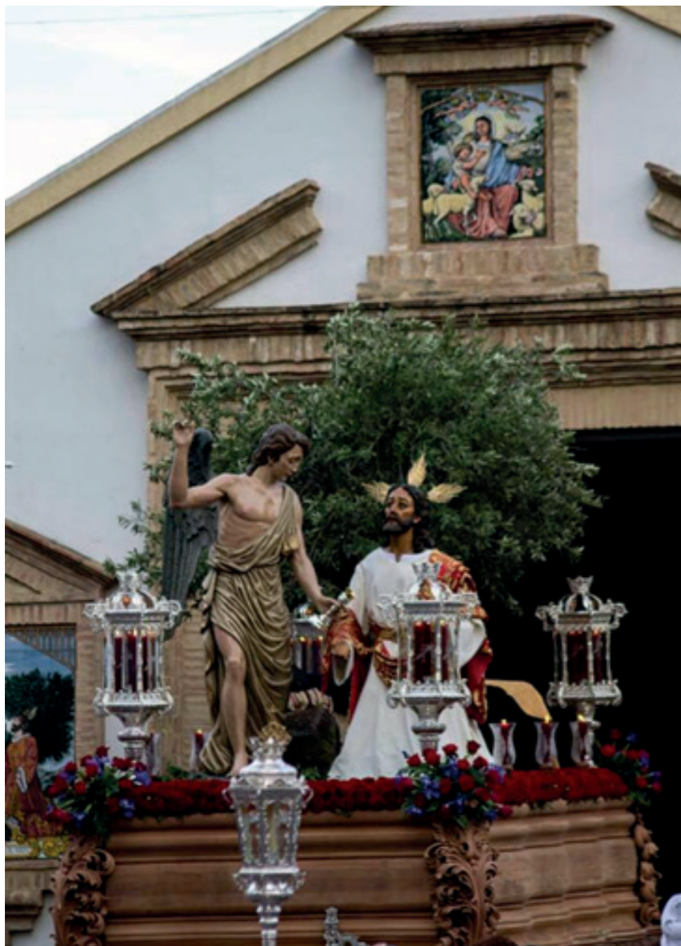
Nuestro Padre Jesús en su Agonía en el Huerto