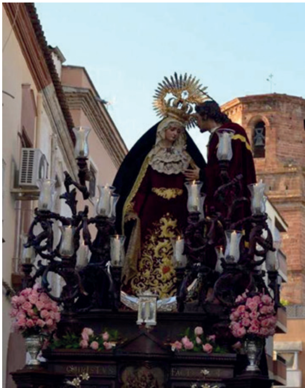
Ntra. Señora de los Dolores