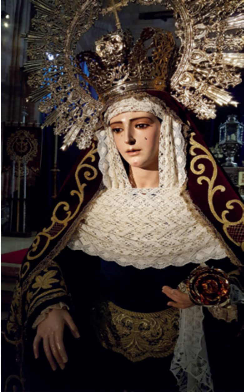
Ntra. Señora de la Amargura