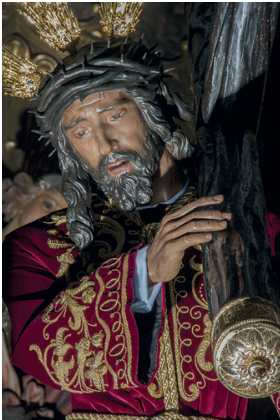
Nuestro Padre Jesús del Gran Poder