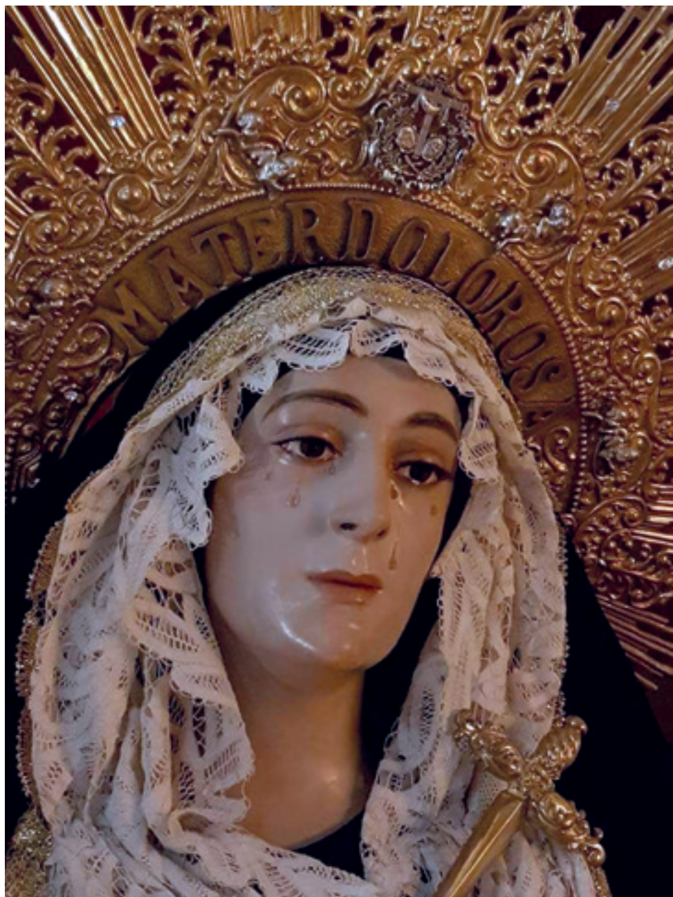
Ntra. Sra. De la Victoria en su Soledad