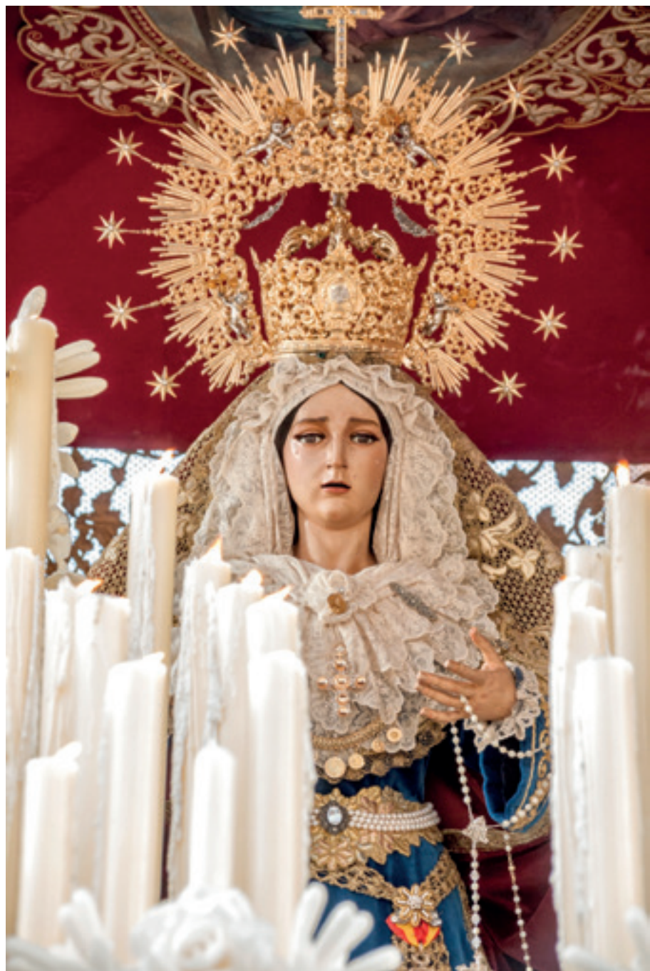
Ntra. Señora del Buen Remedio