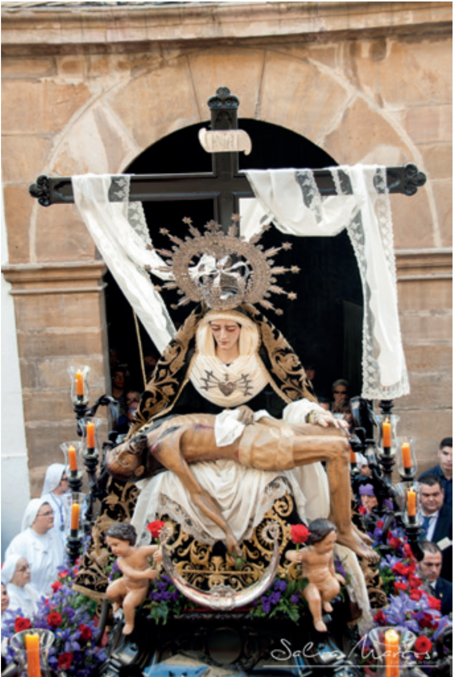
Ntra. Sra. de las Angustias