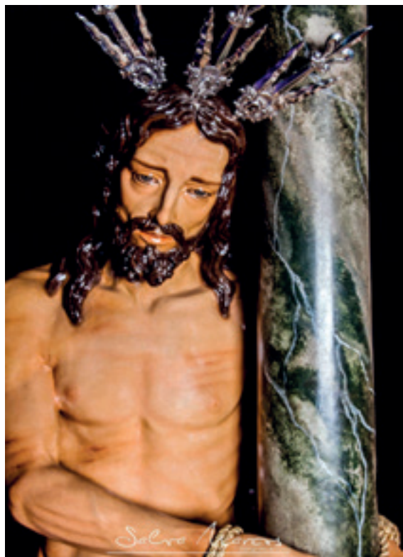
Ntro. Padre Jesús Atado a la Columna

DATOS ARTÍSTICOS DE LA IMAGEN: Nuestro Padre Jesús atado a la Columna obra del imaginero extremeño afincado en Sevilla, maese don Juan Blanco Pajares. Realizada en el año 1944 según el canon renacentista que muestra a Cristo atado a una columna del pretorio de fuste largo. La Sagrada Imagen de Nuestro Divino Salvador fue restaurada en 2011 por el escultor-imaginero cordobés, maese don Manuel Luque Bonillo.