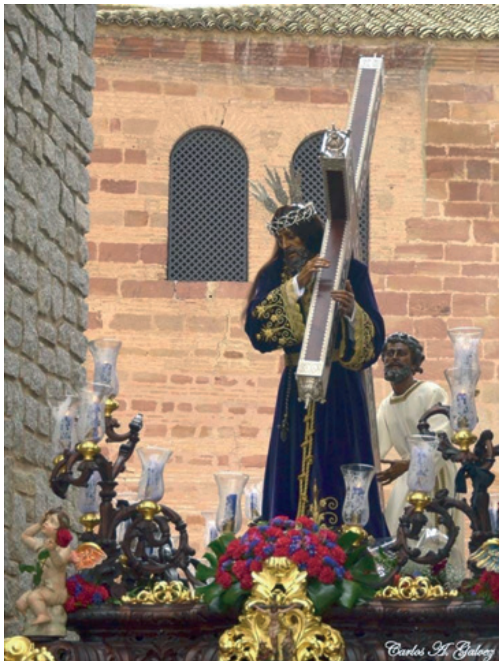
Ntro. Padre Jesús Nazareno “Señor de los Señores”