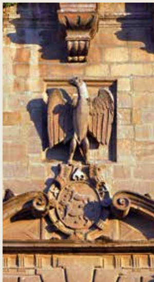
Niños de Don Gome Palace.