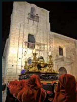
El Santo Sepulcro