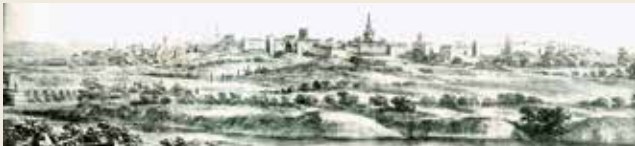
View of Andújar. by Pier Maria Baldi. 1168

Andújar and its surroundings have always had a privilege situation due to its commercial routes with different artistic and cultural influences.