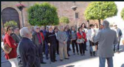
Visitas guiadas.

Sepa el viajero que a esta histórica ciudad de Andújar llega, titulada igualmente Muy Noble y muy Leal, de origen árabe, heredera de la antigua Isturgi (a unos 6 km de la actual Andújar), que será acogido con hospitalidad por sus vecinos, de carácter abierto y alegre.