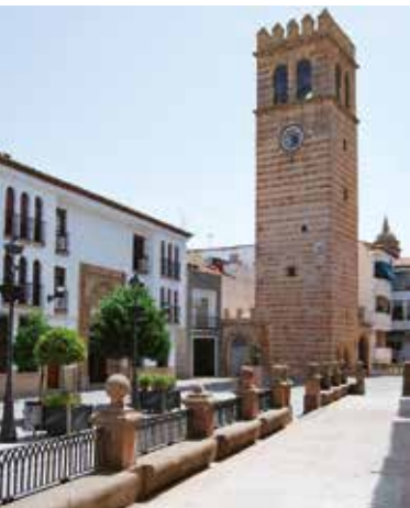
Torre del Reloj et l'entrée de la maison d'Albarracín