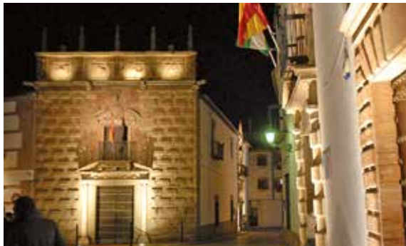
Palais des Cárdenas, des Segundos Cárdenas et façade des Pérez de Vargas