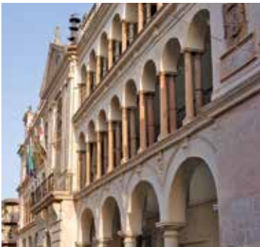
Casa de Comedias, now townhall