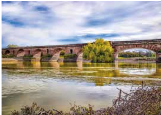
Pont romain @ leltxu lphotsuar

C'est une commune plate , où les promenades aux ses rues et places sont agréables. Le centre historique médiéval est un bien d'intérêt culturel depuis 2007 dans la catégorie d'ensemble historique , déclaré par la Junte d'Andalousie dans son conseil de gouvernement, en raison de l'entretien des valeurs urbanistiques et architecturales de la ville, que reflètent les étapes historiques de son évolution.