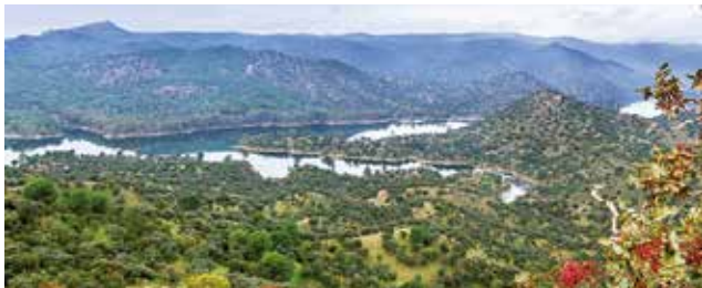
Sierra de Andújar Natural Park. In the background we see the Virgen de la Cabeza Sanctuary

Fauna wolf, Iberian lynx, Egyptian mongoose, otter, golden and imperial eagles, black vulture, Eurasian eagle-owl, wild boar, deer, fallow deer, European mouflon, and Spanish fighting bull