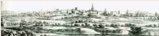
Vu d'Andujar par Pier Maria Baldi. 1168

Andújar y su entorno han tenido siempre una situación privilegiada por ser una encrucijada de rutas comerciales con influencias artísticas y culturales de diversas procedencias.