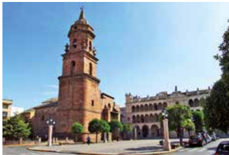
Paroisse de San Miguel et Casa de Comedias, aujourd'hui la mairie.