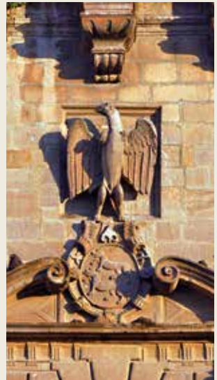
Palais Niños de Don Gome.