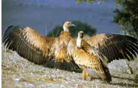
Griffon vulture © Aquilino Duque

Among the MAMMALS we can highlight the Wolf and the Iberian lynx , with a high population in Spain; the Egyptian