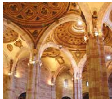
Principal transept of Santa María © Manuel José Gómez

From here, we will go to Santiago and Santa Marina Church , an old Arabic mosque; to Jesuits School (17th-18th centuries) with a baroque vault in the stair (imperial style), and to San Bartolomé Church (15th-17th centuries) which is an artistic historical monument. We are continuing through Calle Jesús María to the Convento Monjas Mínimas de Jesús María (15th), with Mudéjar coffered ceiling in the main chapel, and then we can see the Virgen de la Cabeza painting (17th-19th centuries). We find this painting in a little outdoor chapel dedicated to the Virgen de la Cabeza: the patron saint of Andújar and of the Diocese of Jaén (with its pilgrimage the last weekend of April).