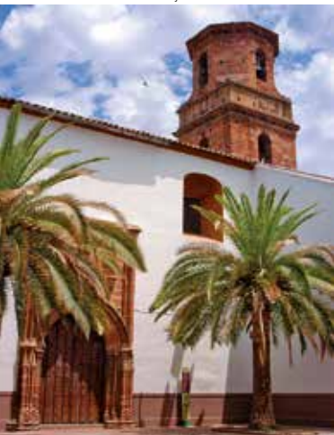
San Bartolomé church. South façade and tower Agony in the Garden El Greco © Juan Vicente Córcoles