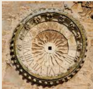
Torre del reloj Detalle

En la actualidad, es considerada una ciudad moderna con una riqueza arqueológica importante, y un enorme desarrollo económico y social.