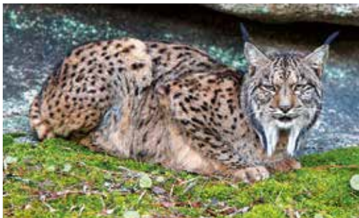
Iberian lynx

mongoose , the otter , the stone marten and the wildcat . Between the hunting species highlights the Wild Boar and the Deer, species so abundant that it is common to see them crossing roads. Likewise, there is a cohabitation in this land of the European mouflon, the fallow deer, the hare, and the rabbit, and a small population of roe deer and Spanish wild goat.