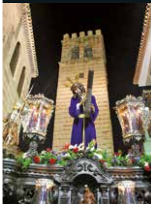
La Vera Cruz

This festivity begins on Palm Sunday with the Brotherhood of La Borriquita, followed by the processions during the week, which reaches its zenith on Holy Thursday and Holy Friday, when it ends. The different local brotherhoods are detailed below: